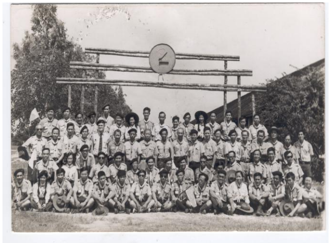
Khoa Ist National Training Course 1970

Có một hôm, tôi ghé lại thăm, gặp lúc Trưởng đang chăm cứu cho một bệnh nhân bị bán thân bất toại, trông rất mệt nhọc, nhưng trên môi vẫn giữ nụ cười hiền hậu. Sau khi bệnh nhân ra về, ngồi uống nước nói chuyện với tôi, Trưởng bảo: Đáng ra, tôi nghĩ đã lâu rồi, nhưng vì nhớ đến câu nói của Baden-Powell; "hãy để lại cho thế giới này một chút gì tốt đẹp hơn so với lúc anh mới chào đời" , nên đến tuổi này, tôi vẫn còn cặm cụi hành nghề châm cứu.