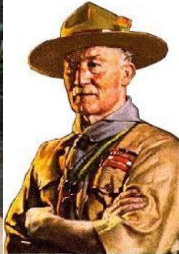
Lord Robert Baden-Powell (1857-1941)

Leave the world in better conditions in wich you found it.