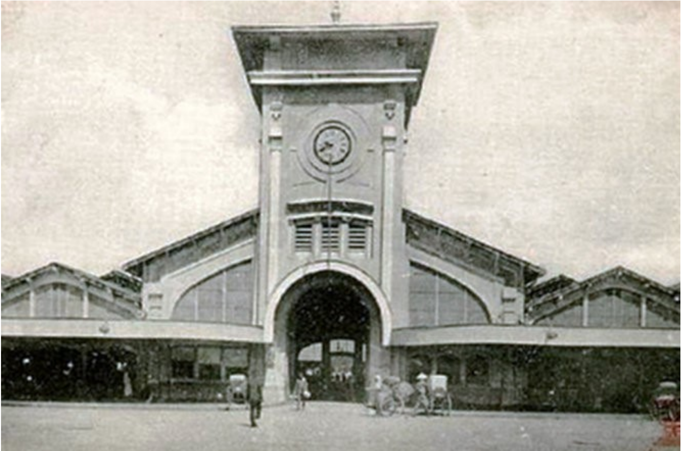
Chợ Bến Thành năm 1914 - Ảnh tư liệu

- Hàng ngàn bà con Sài Gòn lẫn dân Nam kỳ lục tỉnh đã tận mắt coi trận đấu có lẽ chưa từng có trên thế giới ngay lễ khai thị chợ Bến Thành tháng 3-1914: một cô gái giỏi võ Việt vờn nhau với một con cạp đang gầm rú liên hồi.