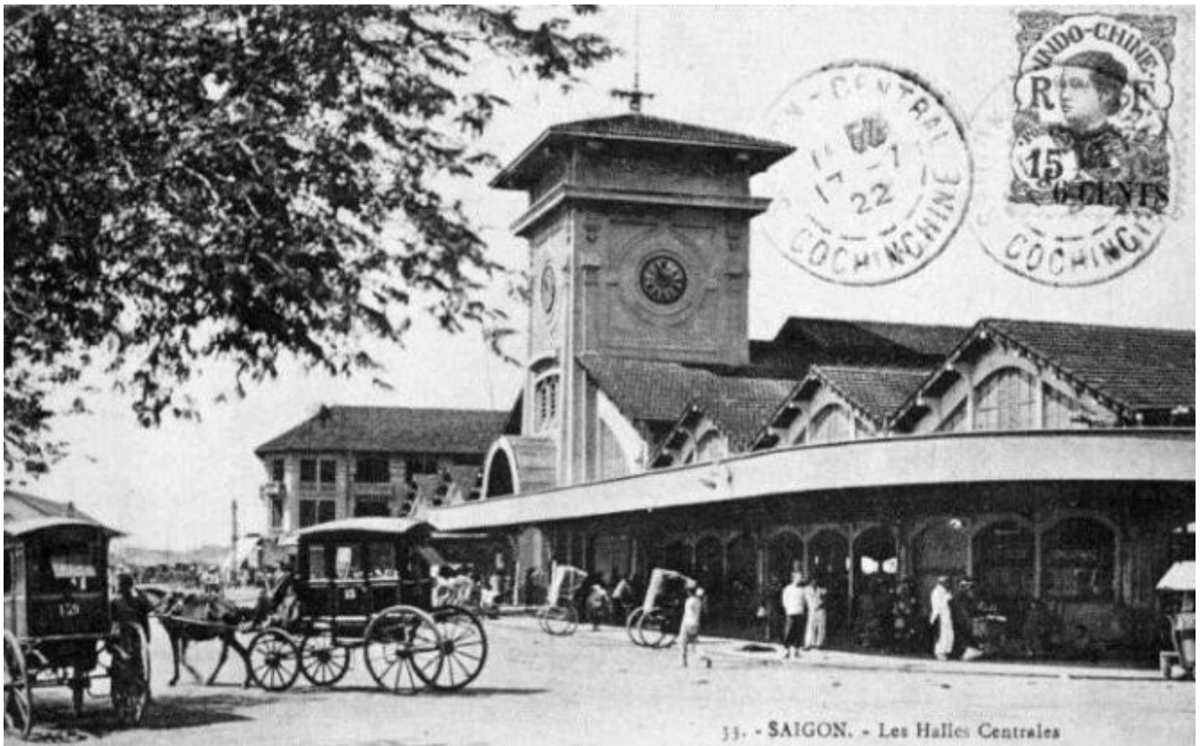
Chợ Bến Thành năm 1921, bảy năm sau ngày khai thị