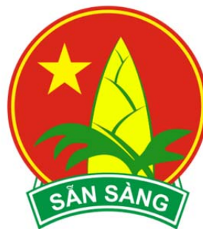
Huy hiệu Đội Thiếu Niên Tiền Phong Hồ Chí Minh