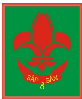
Huy hiệu Hương Đạo VN

[Chúng tôi sẽ kèm theo bên dưới, sau bài viết này là bài viết “Những Khúc Quanh Lịch Sử của Phong Trào HĐVN”, bằng hai ngôn ngữ Việt, Anh (Vietnamese and English) để các độc giả tham khảo thêm.].