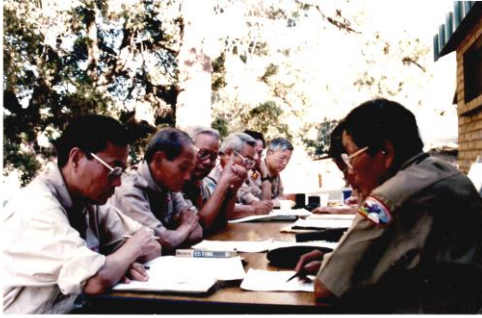
Toán HL ngành Tráng thảo luận về 2 PAGDNT của Trường Vĩnh Đào và Nghiêm Văn Thạch tại Lost Valley vào mùa Hè năm 1994

Nội san Trường số 5 và 6 phát hành ngày 15 tháng 7 năm 1995, có giới thiệu PAGDNT chuẩn bị tiến vào Thế kỷ 21 do Trường Nghiêm Văn Thạch soạn. Tác giả đề nghị một chương trình hướng dẫn Tráng sinh nam và nữ tự phát triển qua 2 giai đoạn Tân Tráng và Hiệp Tráng.