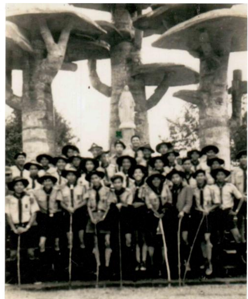
Tráng đoàn Bạch Mã Huế viếng thăm Nhà Thờ Đức Mẹ La Vang, Quảng Trị