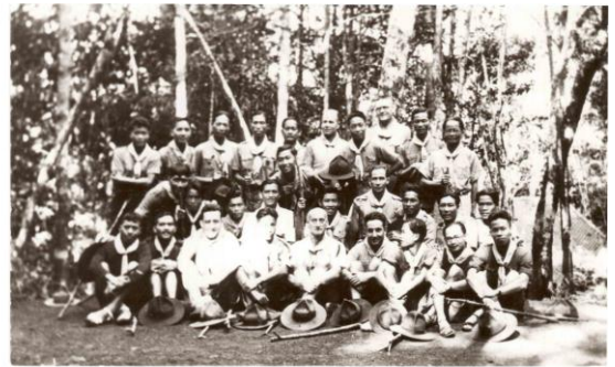
Khóa Bạch Mã Tráng đầu tiên năm 1938